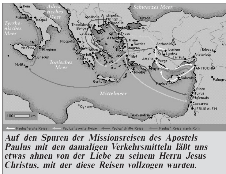
Auf den Spuren der Missionsreisen des Apostels Paulus mit den damaligen Verkehrsmitteln läßt uns etwas ahnen von der Liebe zu seinem Herrn Jesus Christus, mit der diese Reisen vollzogen wurden.

der wenig bewirkt, weil Christus durch uns nicht wirken kann. Man kann viel für Jesus tun. Aber was bringt das alles, wenn Jesus nicht die Möglichkeit hat, an mir und dann auch durch mich zu wirken? An missionarischen Aktionen fehlt es in unserem Land gewiß nicht, und auch nicht an immer wieder neuen Ideen, von Gott zu berichten und Christus zum Thema zu machen. Aber kann Jesus Christus selbst wirken? Ist Christus so in uns lebendig, daß Er durch uns Frucht wirken und Sein Reich bauen kann?