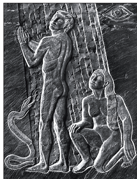
Die »große Verführung« am Anfang unserer Weltgeschichte.

Jeder lebendige Christ weiß um Niederlage und Sieg im Kampf mit den bösen Geistern. Niederlagen erleben wir dann, wenn böse Geister sich in unserem Leben durchsetzen können. Siege erfahren wir, wenn wir die Versuchung böser Geister als solche erkannt und im Namen Jesu abgewiesen haben. Eine unbereinigte Niederlage wird unser Verhältnis zu unserem Herrn trüben in Richtung der Finsternis. Ein Sieg über die Geister, über den wir uns nicht rühmen, sondern unserem Herrn die Ehre geben, erhellt unser Verhältnis zu Ihm in Richtung des Lichtes. Mit unserem Leben durch Gesinnung und Taten stehen wir immer zwischen Finsternis und Licht und entwickeln uns in die eine oder andere Richtung.