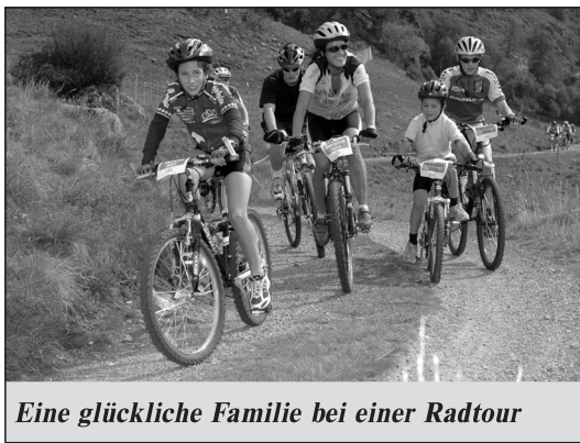
Eine glückliche Familie bei einer Radtour

Adorno vertrat die Auffassung, daß die Etablierung des Nationalsozialismus die in Deutschland praktizierten „preußischen Tugenden“ wie Wahrhaftigkeit, Ehr-