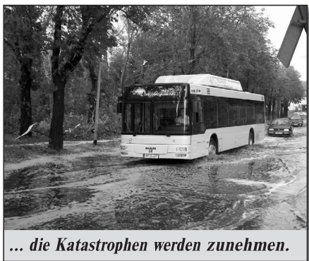
... die Katastrophen werden zunehmen.

✉ Wo bleibt die Hilfe des Gottes Abrahams, Isaaks und Jacobs, möchte man hier fragen. Doch wie sollte Gott helfen, wenn sich der Staat Israel nicht auf IHN, sondern auf die Stärke des eigenen Arms verläßt? Dabei sollte man wissen (Sa 4, 6), daß „Rettung nicht durch Heer oder Kraft, sondern durch meinen Geist geschehen soll.“ Doch das Volk der Juden sieht nicht, daß es nur von einer Seite Hilfe und Rettung erfahren kann: durch den von Gott gesandten Messias Jesus Christus, den man nicht erkannte und auch heute noch nicht erkennt. Wie sehr würde man dem leidgeprüften Volk Jesu Liebe und Hilfe jetzt schon wünschen! Doch der weitere Weg des Volkes ist in der Schrift vorgezeichnet: der Weg in und durch