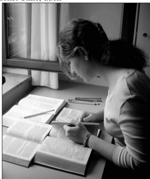
Zum „Handwerkszeug“ des Bibelstudiums gehören: Bibelleseplan, zweite klassische Bibelübersetzung, Konkordanz.

Aber fehlt uns manchmal nicht dieses Verlangen nach Gottes Wort? Was dann? Wir beten und lesen in der Bibel einfach weiter, bis wieder die Freude an Gottes Wort aufkommt. Oder wir müssen im Glaubensgehorsam bereit sein, die erkannten Wahrheiten der Bibel anzunehmen. Es könnte nötig sein, sich von blockierender Bindung oder Sünde im Namen und in der Kraft Jesu Christi zu lösen.