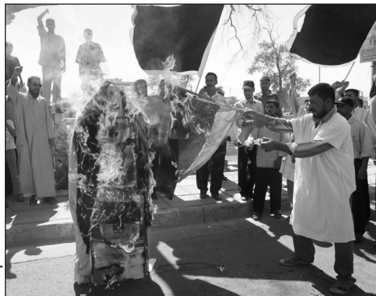
„Hass gegen den Westen und das Christentum: Irakische Demonstranten verbrennen ein Papst-Abbild und die deutsche Fahne. (die Welt vom 18.09.2006)

die Stellungnahme des Zentralrats der Muslime zu den Äußerungen von Edmund Stoiber, der in einem Interview die Meinung vertrat, das Christentum unterscheide sich dadurch vom Islam, „daß wir Intoleranz ablehnen, Religionsfreiheit gewähren, die Gleichberechtigung von Mann und Frau vertreten, Zwangsheiraten nicht billigen.“ Stoiber habe – so der Zentralrat der Muslime – mit seinen polemischen Äußerungen den gesellschaftlichen Frieden gestört und