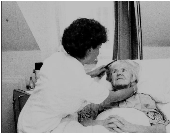
Liebevolle Zuwendung am Krankenbett und das gemeinsame Gebet richten den Kranken auf.

In einem alttestamentlichen Gebet heißt es: „Ich rufe zu Gott, dem Allerhöchsten, der