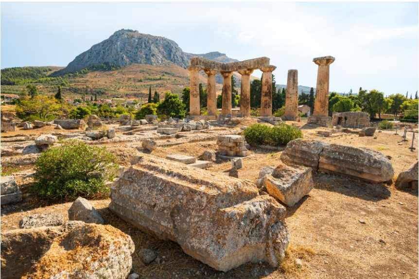
Das antike Korinth, Wirkungsstätte des Apostels Paulus